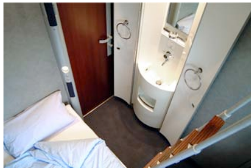
Abteil Typ B - Waschsäule