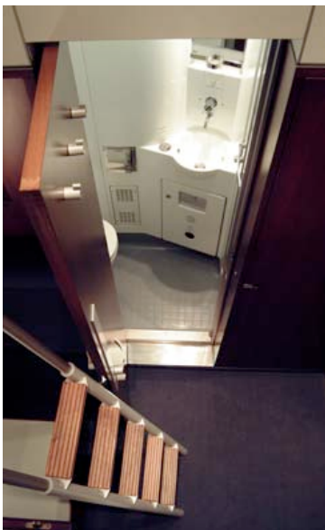
Abteil Typ A - Eingang Dusch-/Waschkabine