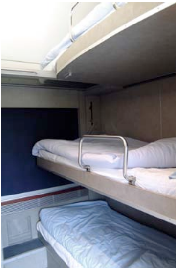
Abteil Typ B - Nachtposition