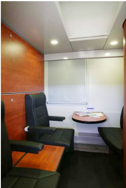
Abteil Deluxe - Tagposition