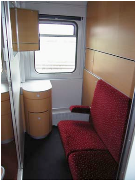
Abteil T2 - Tagposition