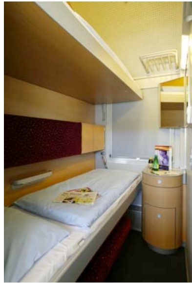
Abteil T2 - Nachtposition