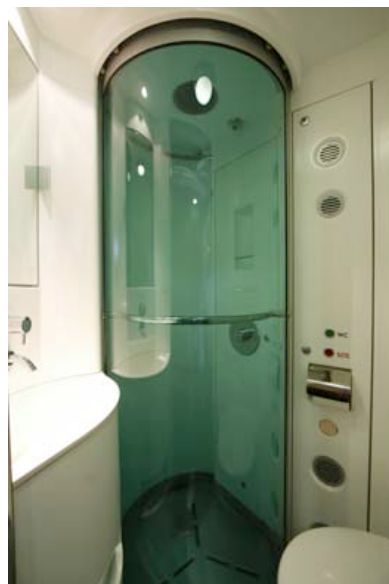
Abteil Deluxe - Nasszelle